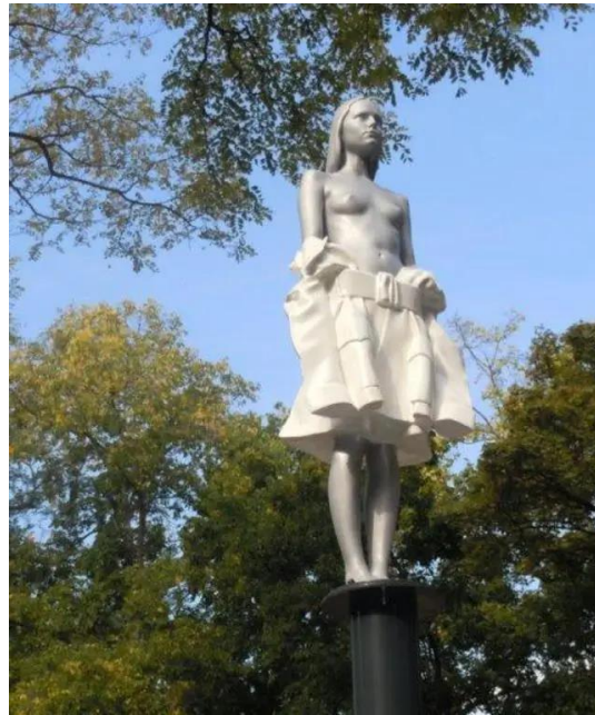
La fée Gyptis

Fille du chef gaulois Nan , Gyptis choisit naguère d'épouser le grec Protis en lui tendant une coupe d'eau fraîche comme le voulait la coutume. La légende dit que de cette union audacieuse est née Massalia la future Marseille. Ainsi Gyptis, la fée du vieux moulin symbolise la fraternité et incarne la condensation dans le cycle de l'eau.