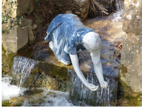
La Fée Marie

La fée Marie : Les Martelières, 83640 Saint-Zacharie