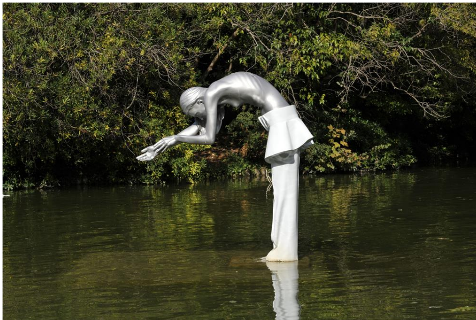
La Fée Ophélie

Penchée sur son lac, tout proche de la Méditerranée, la fée Ophélie pleure sur son fleuve perdu dont les eaux, encore trop polluées ont été détournées par les Hommes. Ophélie incarne l'évaporation et symbolise par ailleurs la sensibilité. Le tempérament nostalgique de cette fée fait écho à celui de l'héroïne de la tragédie de Shakespeare, Hamlet.