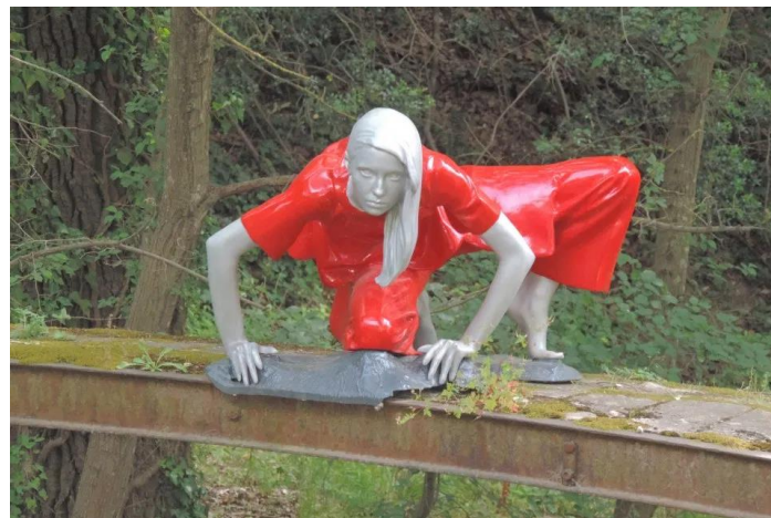
La Fée Ubelka

Ubelka est le nom primitif de l’Huveaune. Pour les gaulois qui habitent la vallée à la période antique le petit fleuve aux crues parfois violentes était une déesse nourricière mais aussi « dévastatrice ». Héritant de ce caractère ambivalent, Ubelka, la fée du pont incarne les précipitations dans le cycle de l’eau . Elle symbolise aussi la reconnaissance.